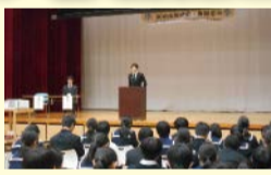
立候補者役による選挙演説

令和7年度、実際に出席授業・模擬選挙を体験した生徒からは「今まではあまり関心や知識がなく、18歳になっても選挙するのかなと思っていたのですが、今では選挙に行きたくなりました」「本物の選挙に行ったかのような体験ができて、とても新鮮でした」「今回体験して、1票の重さについて実感しました。自分の1票でも、世界が動く気がしたので、来年は選挙に行ってみたい」「若者の投票率が下がっているのは、投票方法が難しいからだと思っていたけど、すごい簡単で行きやすい」などの感想がありました。