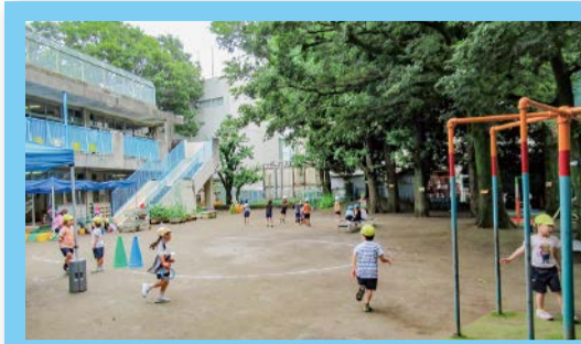
自然いっぱいの楽しい園庭

本校のマスコットキャラクター「しおみん」がお出迎えする玄関ホール。ここでは、行事の開閉会式、合同授業、他学年同士の交流、PTA 行事などさまざまな催しが行われます。放課後はアクティの遊び場となるなど、みんなが集まるスポットです。