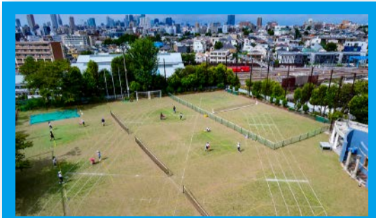
8階プールから見える風景

園庭が広く、自然が豊かな千駄木幼稚園。園歌にも出てくるシイの木、タブの木、ケヤキの木などたくさんの木々が四季折々の自然の姿を子どもたちに見せてくれます。子どもたちは、毎日自然に触れ合いながら暖かな日差しの下で元気に楽しく遊んでいます。