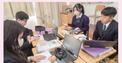
グループ学習の様子(第八中学校)