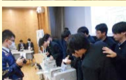
開票の様子(計数作業)