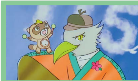
地域で活躍する千駄木小のキャラクター

本校は8階にプールがあり、可動式屋根が付いています。窓から外を見ると、校庭で生徒が活動する様子や、丸ノ内線の車両基地などが見えます。生徒が茗台中の名所を紹介する際にもしばしば話題になる絶景スポットです。