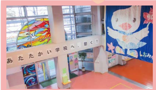
みんなの笑顔が集まる「あたたかいホール」