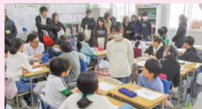
学んだことを活用してスピーチをする様子(柳町小学校)