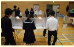
投票の様子(投票用紙記載)