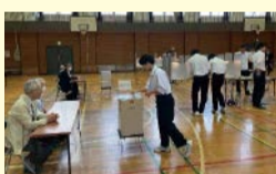
投票の様子(投票用紙投函)