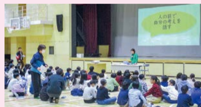
一般社団法人アルバ・エデュによる出張授業の様子(柳町小学校)

子どもたちは、一般社団法人アルバ・エデュの方からプレゼンテーションの基礎を学び、アプリを使って自分の考えを広げたり深めたりしました。