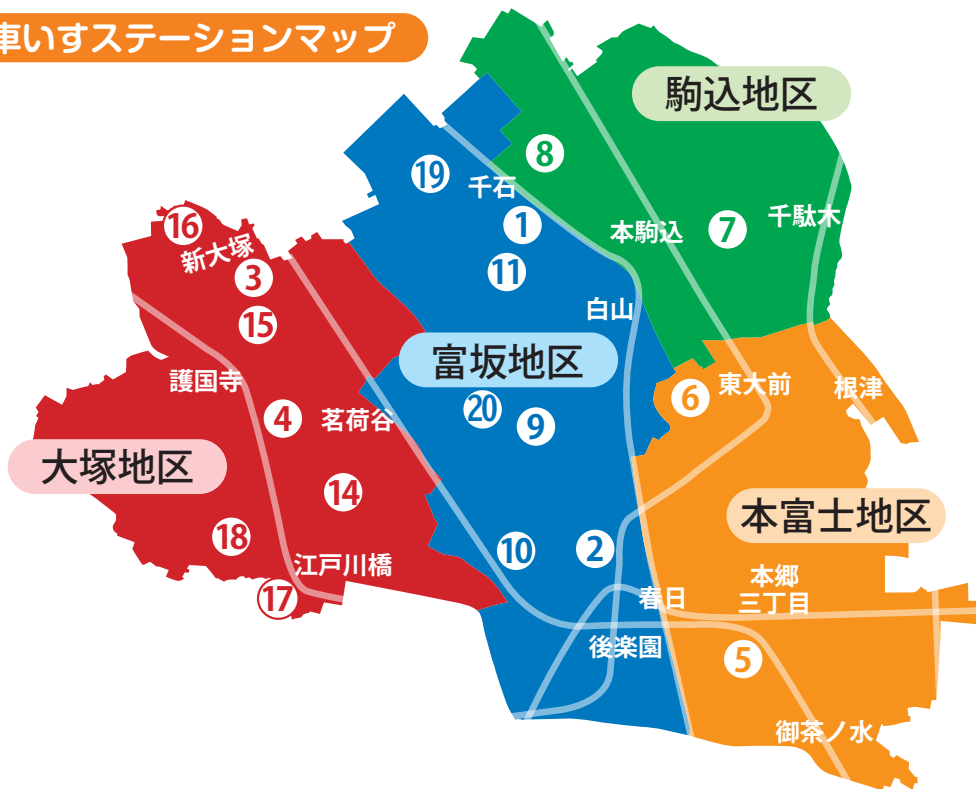
車いすステーションマップ