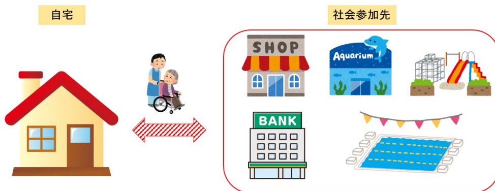
図 1 移動支援のイメージ